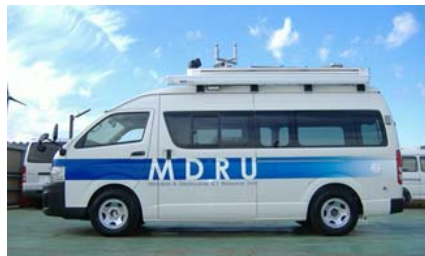
図：今回開発したICTカー