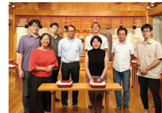
Fig. 5 Visit Prof. Datu from Arizona State University.