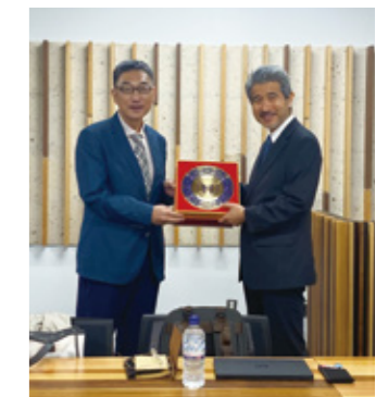
Fig. 6 Visit from University Science and Technology Beijing.