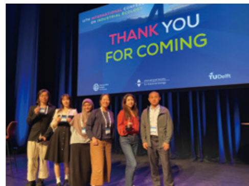
Fig. 2 Participation in the International Conference on Industrial Ecology.