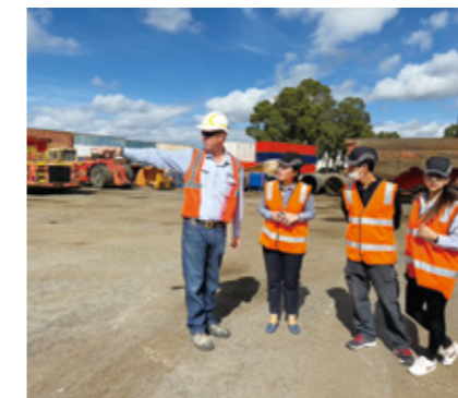
Fig. 4 Workshop at a mining company in Australia.

世界の社会経済活動の全面的な再開に伴い、当研究室は、物質循環や資源採掘や半導体製造に伴う環境負荷、食料を通じて生じる栄養塩のフットプリント、資源の国際的なサプライチェーン解析などの分野において国際的な学術活動に参加し、建設的な議論を交わすと同時に、国際ネットワークを築いてきた。例えば、オランダのライデン大学で開かれた The 11th International Conference on Industrial Ecology (Fig. 2)、ガーナの SETAC Africa 11th Biennial Conference (Fig. 3)、ケンブリッジ大学の Net Zero and Sustainability Forum 2023、ストックホルム大学及びオーストラリアのカーティン大学のワークショップ (Fig. 4) がある。また、アリゾナ州立大学 (Fig. 5)、清華大学や北京科技大学 (Fig. 6)、国際応用システム分析研究所などからの専門家が訪問し、今後の国際的な連携協力を促進した。