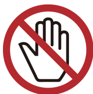
ケースなどにさわらない