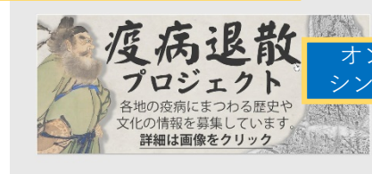
オンライン シンポジウム