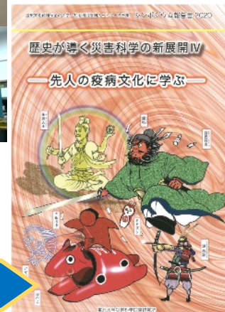
シンポジウム 報告書

疫病文化は地域社会の実態にあわせて柔軟に変化し、独特な信仰を形成。 感染症流行の収束にむけて重要なのは、医療・政策だけではなく地域社会の動向