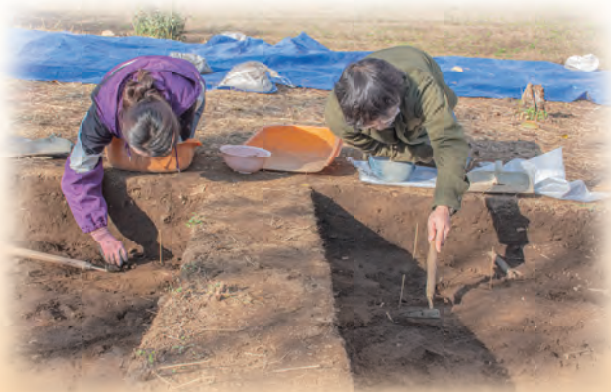
姥沢遺跡発掘調査の様子