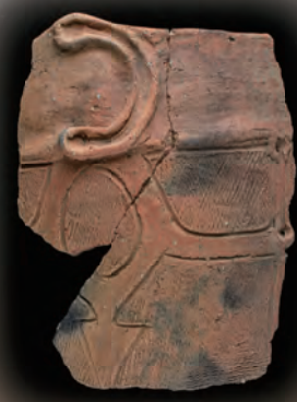
姥沢遺跡出土土器 (縄文時代後期前葉)