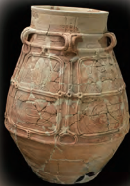
青森県青森市・山野峠遺跡出土土器 (喜田貞吉博士調査資料)

本年、東北大学は創立115周年、さらに法文学部設置による総合大学100周年を迎えます。法文学部には、奥羽史料調査部が大正14(1925)年に設置され、喜田貞吉博士が膨大な考古学資料を蓄積し、研究を進めました。今回の展示では、総合大学100周年を記念し、奥羽史料調査部の収集資料も合わせて展示します。