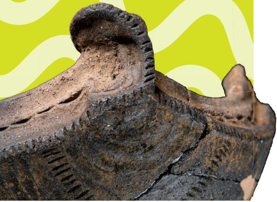
柴田町 向畑遺跡