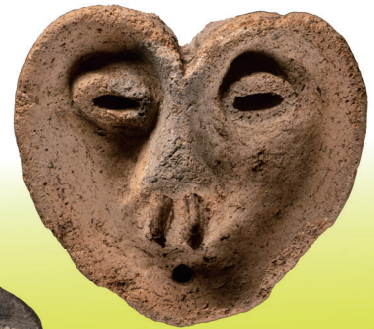
蔵王町 二屋敷遺跡 (東北歴史博物館蔵)