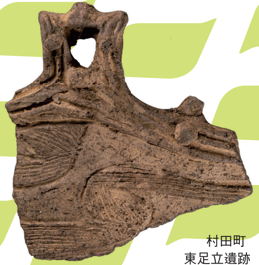
村田町 東足立遺跡